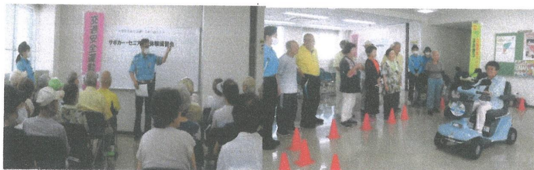
サポートカー、セニアカー乗車体験会