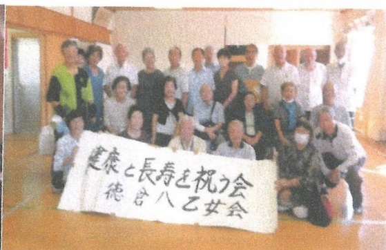
敬老大会(自分たちでお祝いました。)