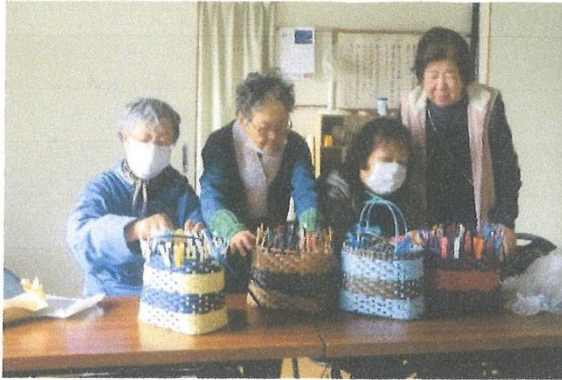
手芸クラブ(エコバンド籠づくり)