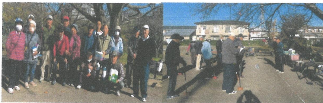
八乙女会グランドゴルフ大会