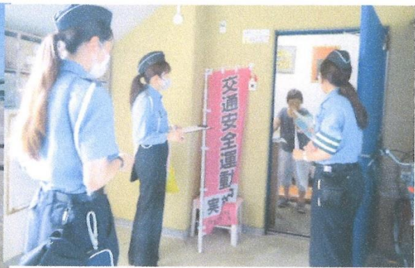
交通安全協会指導員と共に高齢者に交通指導家庭訪問