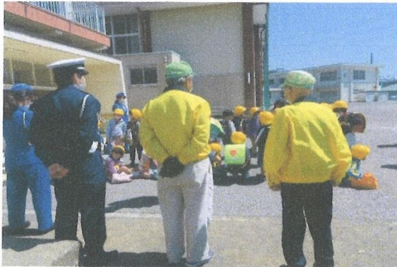
新1年生交通教室(徳倉小学校)