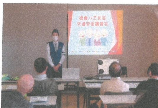
八乙女会交通安全教室