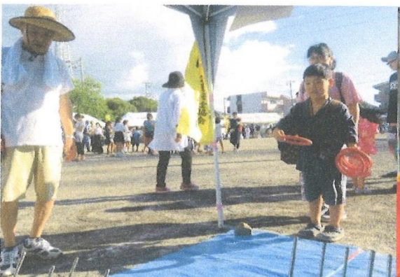
徳倉夏祭りに参加(子供たちと輪投げを行いました。)