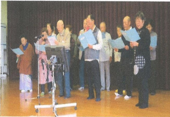
北上老連親睦会にて