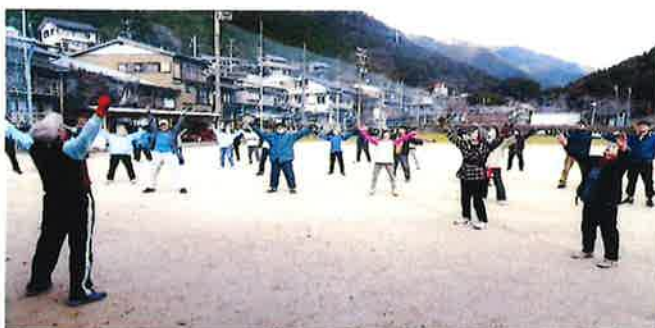
《怪我防止は体操から》