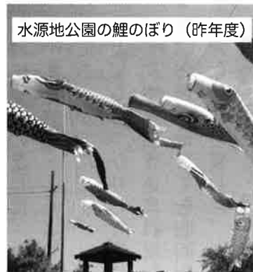
水源地公園の鯉のぼり (昨年度)