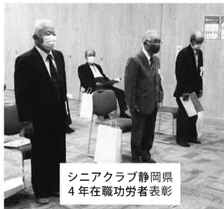
シニアクラブ静岡県 4年在職功労者表彰