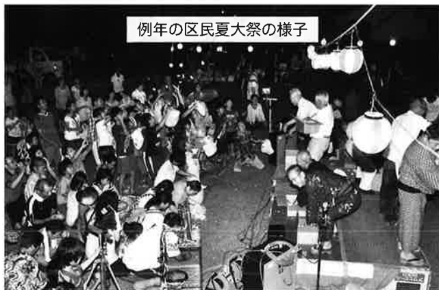
例年の区民夏大祭の様子

歳末を控える12月には 松、竹、梅など、約3メー トルの高さの門松を毎年公 民館前に区役員とシニア会 員で作って新年を迎えます。 4月には草刈りを行い、 5月には水源地公園に、子 供たちの喜ぶ鯉のぼりを揚 げます。二十数匹余りの鯉 のぼりが五月晴れの空を泳 ぐ姿は笑顔を誘います。 この地区の名前を語る 「十九首塚」の供養祭は、