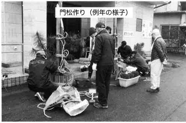
門松作り (例年の様子)

今後、感染が収まる方向を 目指し、シニアの活力で打ち 勝ちたい。 当十九首憩会も、皆さんと