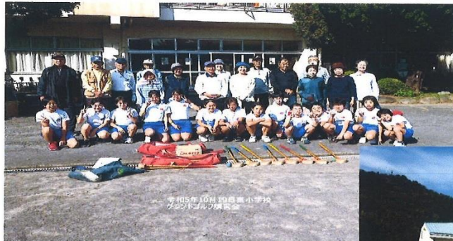
ナイスショットです